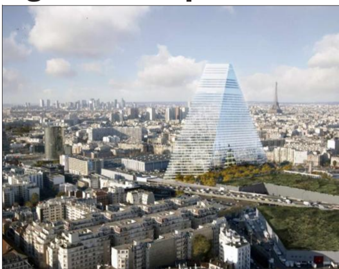
Le chantier de la tour Triangle vient de débuter Porte de Versailles à Paris. Document cabinet Herzog & De Meuron

Le chantier de la tour Triangle, future 3 e construction la plus haute de Paris, vient de débuter. À l'origine de ce projet pharaonique, les deux architectes bâlois Herzog et De Meuron, dont les dernières réalisations bâloises préfigurent ce futur morceau de choix, le pendant du « cornichon » londonien.