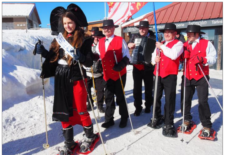
Les organisateurs participent régulièrement à l'événement en costumes traditionnels.

La 18 e édition de l'Alsacienne de raquettes, organisée par le magasin Speck-sports et par le Ski club Ranspach, aura lieu ce dimanche 20 février de 9 h à 14 h, à la station du Markstein. Cette véritable marche populaire sur les sommets vosgiens rassemble aussi bien des randonneurs débutants que des experts des raquettes à neige. Deux parcours de 5 km et 10 km seront proposés aux participants. En dehors de l'aspect sportif et de loisirs, l'Alsacienne de raquettes, c'est aussi un grand moment convivial et festif. Les équipes de Speck sports ont pris l'habitude de participer à l'événement en costumes traditionnels alsaciens.